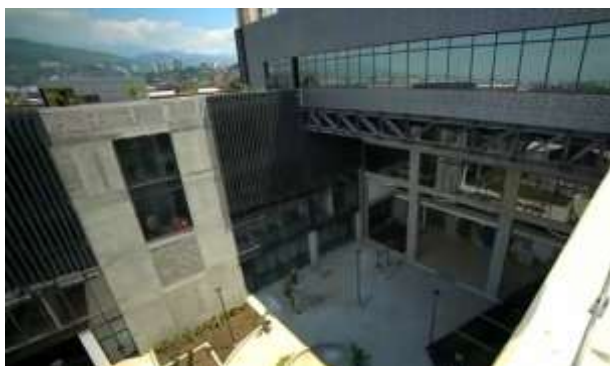
Foto 3: Articulación volumétrica y conexión estructural del edificio.