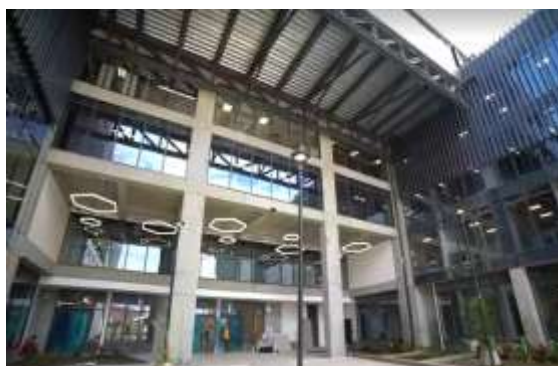
Foto 4: Área acceso y circulación