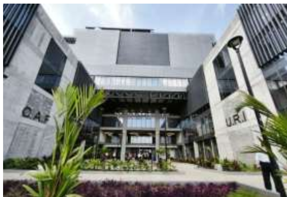
Foto 2: Espacio institucional de acceso y circulación de la Sede Única