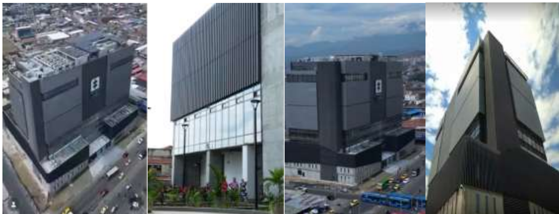
Foto 5: Registro fotográfico estado final de la Sede Única de la Fiscalía General de la Nación – Santiago de Cali, correspondiente al cierre de la Fase de Construcción y previo al inicio de la Etapa de Operación y Mantenimiento. Las imágenes evidencian la implantación urbana, configuración volumétrica, tratamiento arquitectónico y condiciones de disponibilidad de la infraestructura institucional.