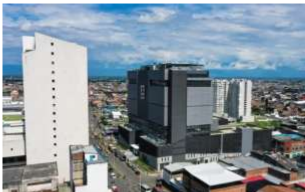
Foto 1: Vista general de la Sede Única de la Fiscalía General de la Nación

A continuación, se presentan registros fotográficos del estado final del Proyecto al momento del inicio de la Etapa de Operación y Mantenimiento: